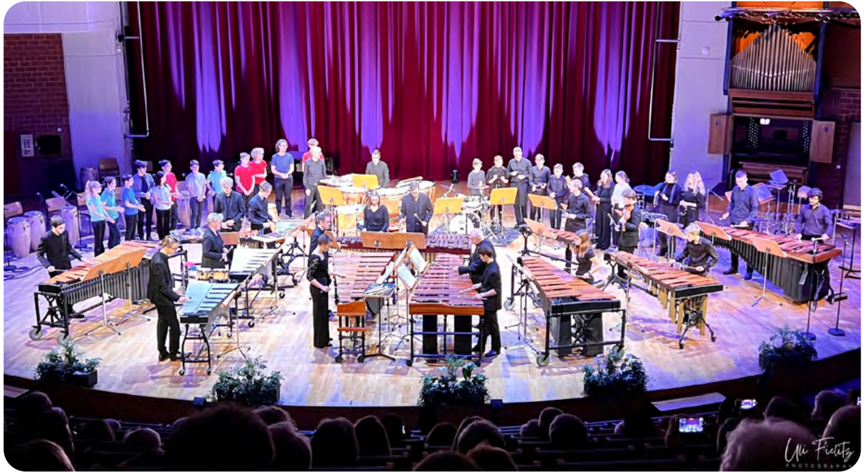
Une extraordinaire performance présentée par l'Ensemble de Percussions du Conservatoire de la Ville de Luxembourg.