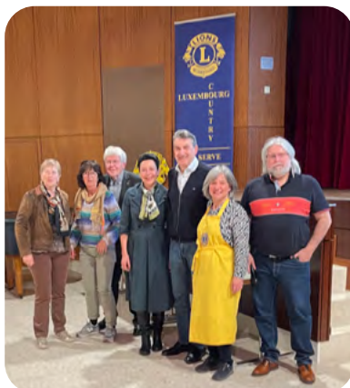
Les gagnants : l'équipe "Murphy's Law"

Merci infiniment pour votre participation, votre générosité et votre engagement envers notre cause.