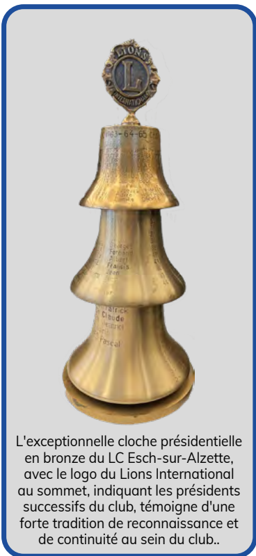
L'exceptionnelle cloche présidentielle en bronze du LC Esch-sur-Alzette, avec le logo du Lions International au sommet, indiquant les présidents successifs du club, témoigne d'une forte tradition de reconnaissance et de continuité au sein du club..